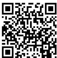
Kod QR nr 1.

Praca domowa _____ Przypomnij o ustawieniu tłumaczenia napisów na język polski. Możesz również skorzystać z tłumaczenia transkrypcji filmu znajdującej się w materiale pomocniczym → 📄 Kod QR nr 0