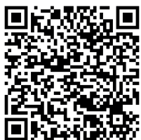
Kod QR nr 0.

Działania poprzedzające _____ Poproś młodzież, aby obejrzała film VOX, The Israel-Palestine conflict: a brief, simple history [tłum. Konflikt izraelsko-palestyński: opis krótki i uproszczony ] [⌚ 10:18 min] → 📄 Kod QR nr 1 Źródło: https://www.youtube.com/watch?v=iRYZjOuUnlU&ab [dostęp: 04.01.2023]