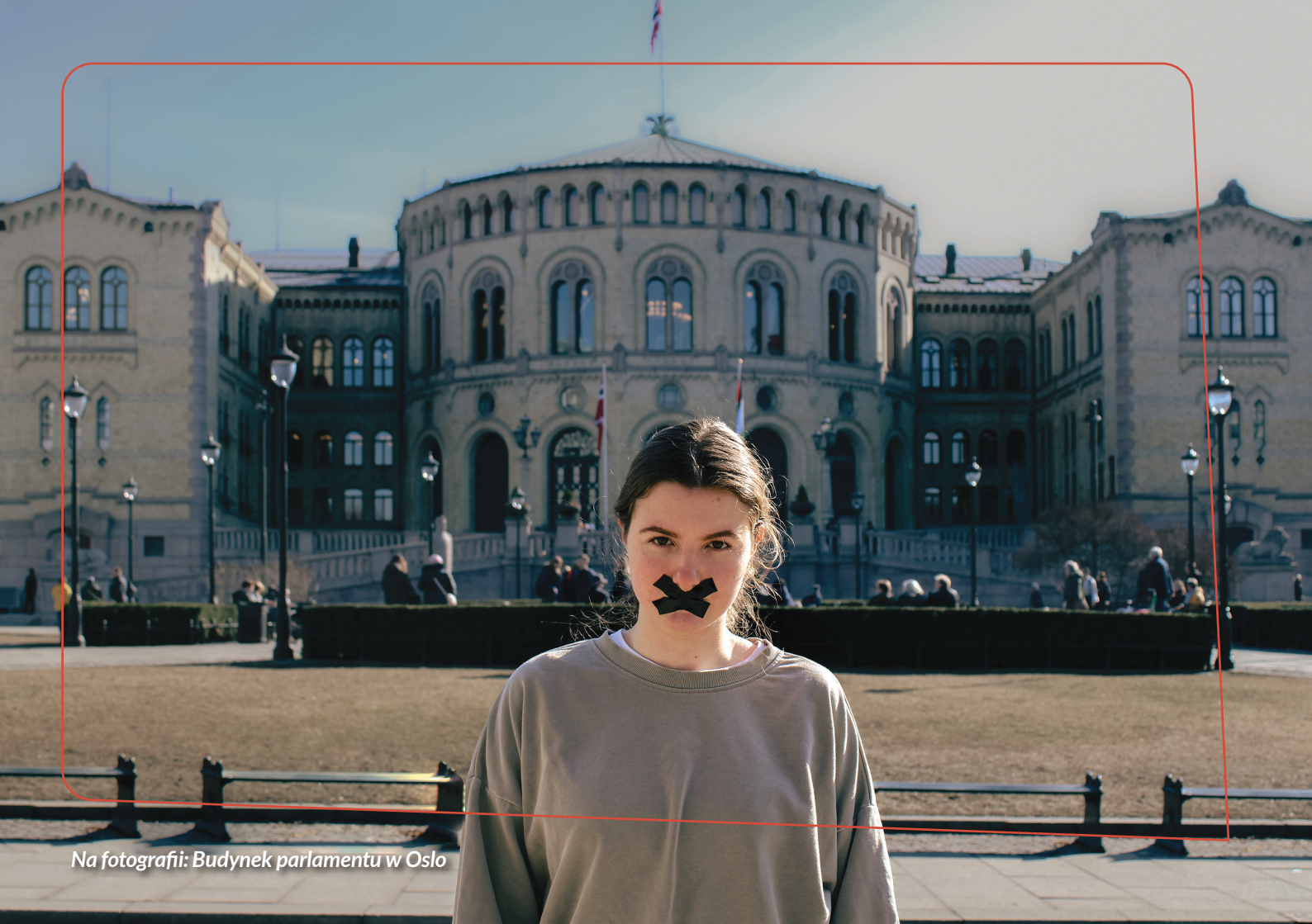
Na fotografii: Budynek parlamentu w Oslo